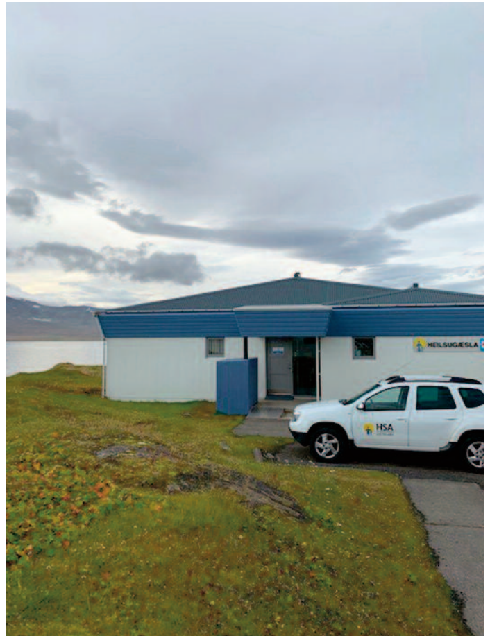
Heilsugæslustöðin á Vopnafirði er nyrsta starfsstöð Heilbrigðisstofnunar Austurlands — HSA — sem nær yfir sveitarfélögin Vopnafjarðarhrepp, Fljótsdalshérad, Fljótsdalshrepp, Borgarfjarðarhrepp, Seyðisfjarðarkaupstað, Fjarðabyggð, Breiðdalshrepp, Djúpavogshrepp og fyrrverandi Skeggjastadahrepp.

Skjólstæðingar stöðvarinnar koma að jafnaði í bókaðar blóðprufur á miðvikudögum og sér læknirinn yfirleitt um að taka þær en hjúkrunarfræðingur sinnir þeim líka, sérstaklega þegar margir koma í blóðprufu eða þegar afleysingalæknar